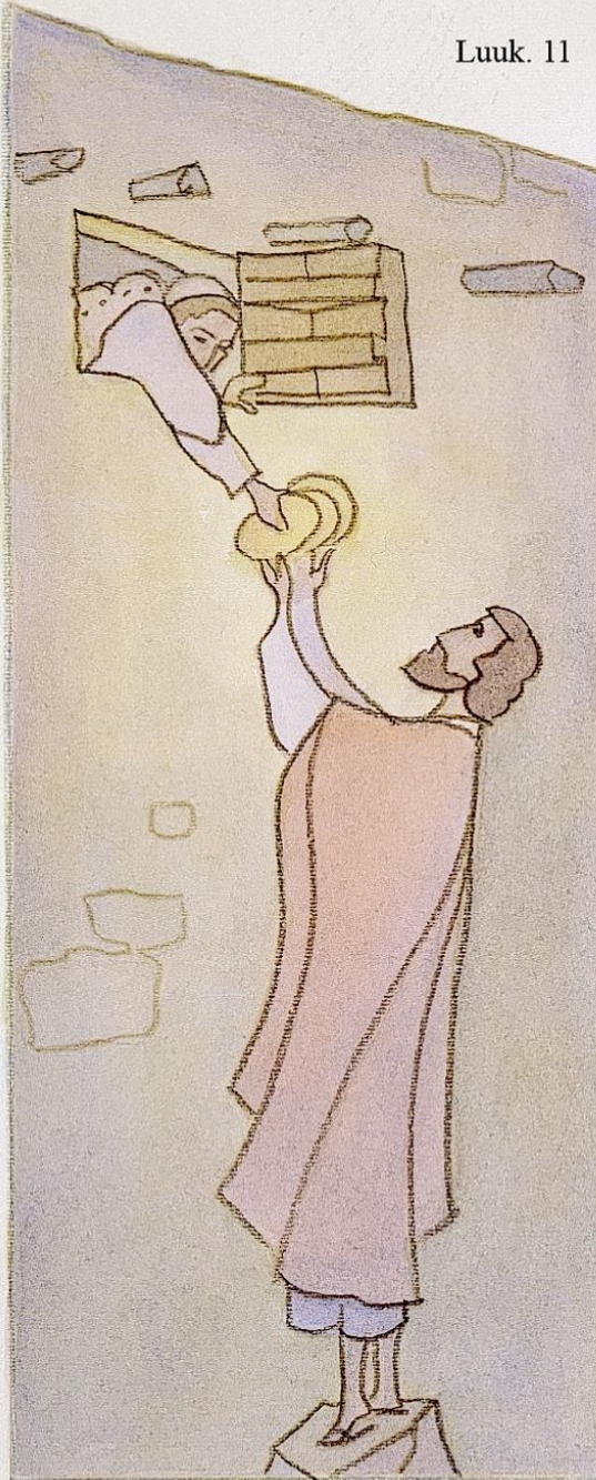
Yöllä vieraalleen hellittämättä leipää pyytävä saa sitä lopulta. Luuk. 11