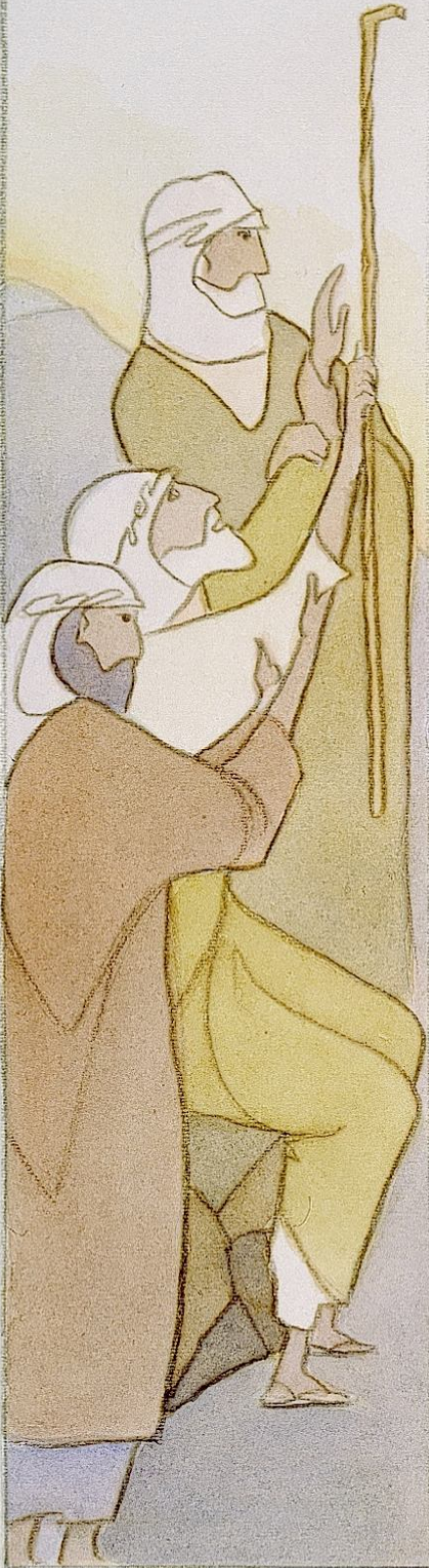
Aaron ja Huur kannattavat Mooseksen rukoilevia käsiä. 2. Moos. 17