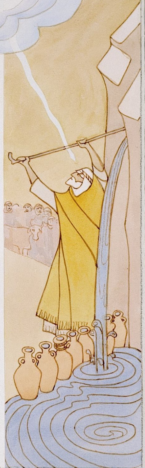
Mooses lyö sauvallaan vettä autiomaan kalliosta. 2. Moos. 17 ja 4. Moos. 20