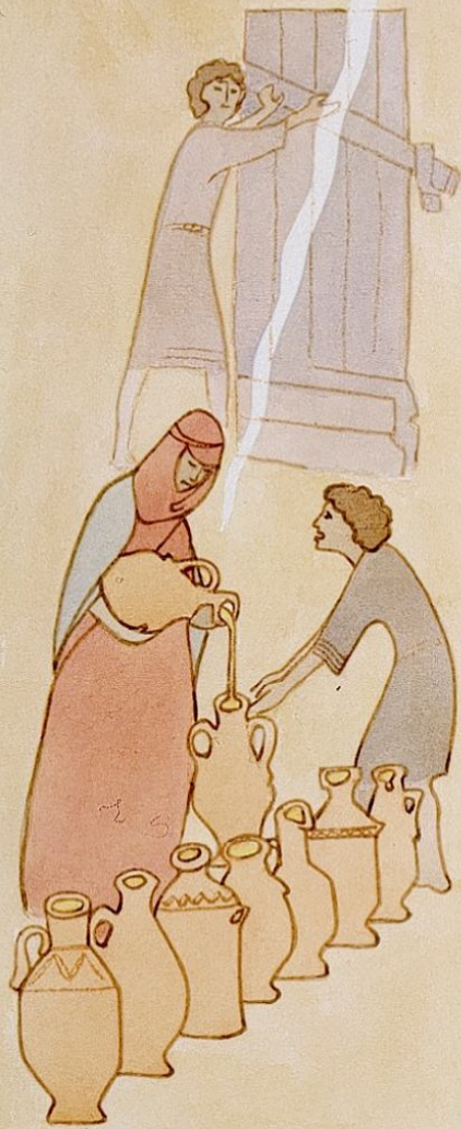
Profeetta Elian öljyihme pelastaa köyhän lesken pojat orjuudelta. 2. Kun. 4